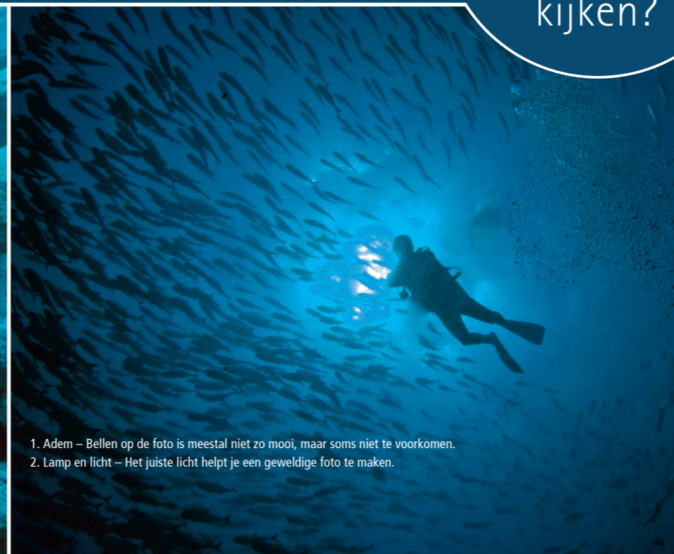
1. Adem – Bellen op de foto is meestal niet zo mooi, maar soms niet te voorkomen. 2. Lamp en licht – Het juiste licht helpt je een geweldige foto te maken.